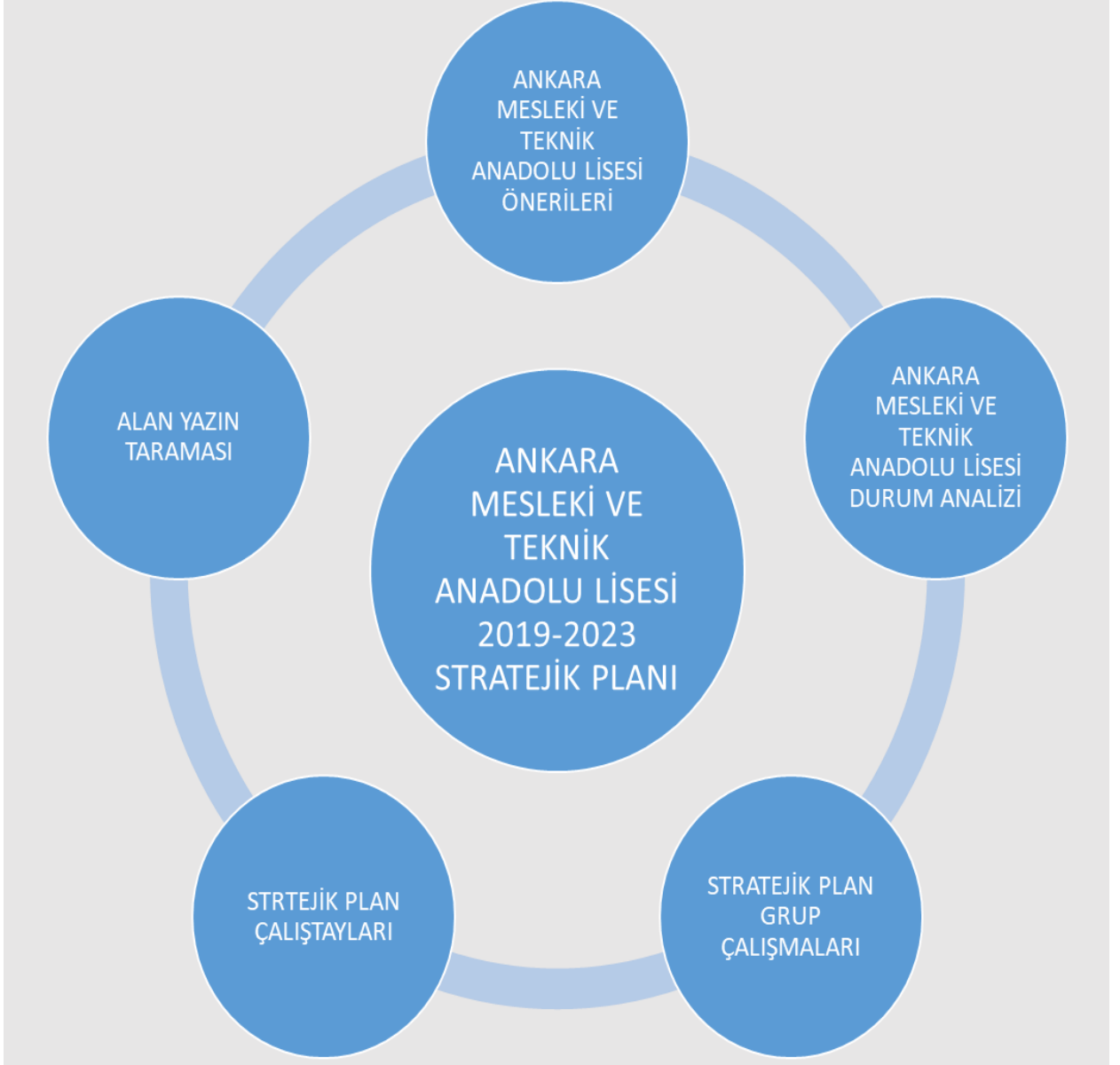
Şekil 1: Stratejik Plan Hazırlık Çalışmaları